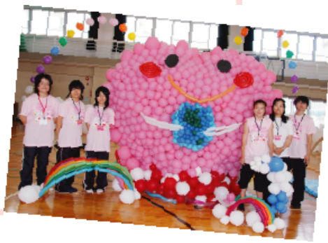
高校生達が熱心に作り上げたバルーンオブジェの数々。