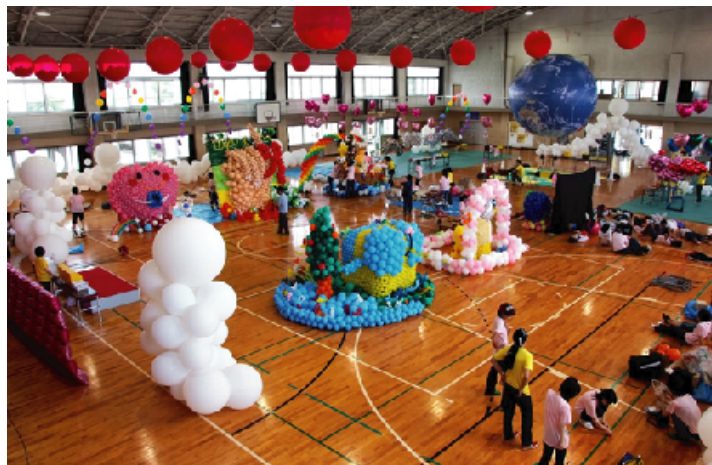
イベントの全体模様（四国大学体育館にて）

8月30(土)〜31(日)の二日間に渡り、第二回目となる、バルーンアート甲子園が開催されました。 実行委員会：アンスバルーンコレクション 開催場所：四国大学体育館