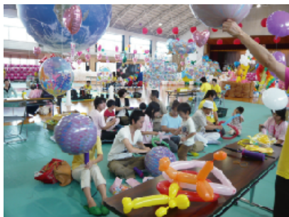
体験コーナーではご家族連れやお孫さんと一緒に来場された方々に皆で楽しくバルーンアートに触れて頂きました。