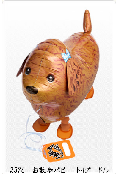
2376 お散歩パピー トイプードル

大人気のトイプードルが仲間に加わりました。 9リットルのミニタイプですので、11.6リットルガス缶とのセット販売も可能です。