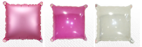
8389 38cmウォールバルーン パールピンク 8334 38cmウォールバルーン クリアピンク 8307 38cmウォールバルーン クリア透明