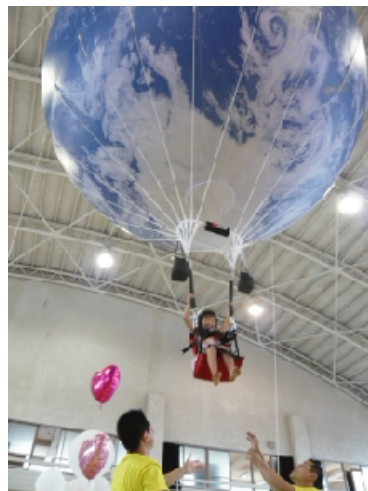
昨年に引き続き子ども達に最も人気だったのが、こちらのジャンピングバルーン！見ていても羨ましかったです。