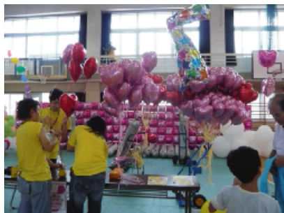
チャリティーバルーン販売の様様