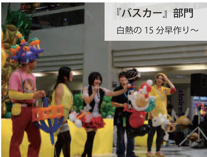
『バスカー』部門 白熱の15分早作り～