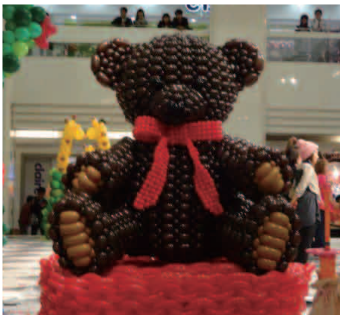
中では大物の 『ミディアムスカラブチャー』部門

QBACの醍醐味は何と言ってもこの『コンペティション』。各パフォーマーが繰り広げる各エントリーの競技は今年もさらに熱を帯びていました。これなくしてQBACは語れません。それにしても全体レベルが高いです～！！