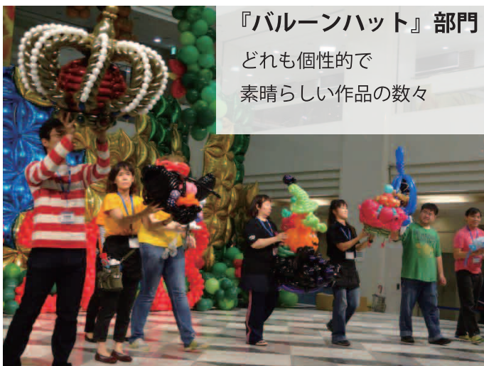
『バルーンハット』部門 どれも個性的で 素晴らしい作品の数々